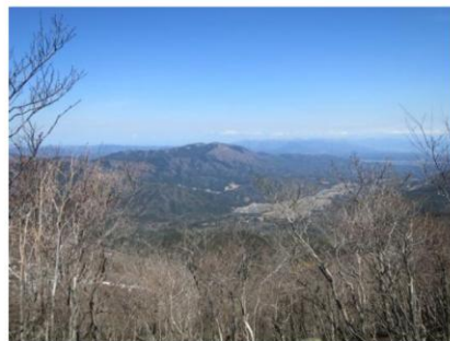
(中央：蛇谷ヶ峰と畑地域)