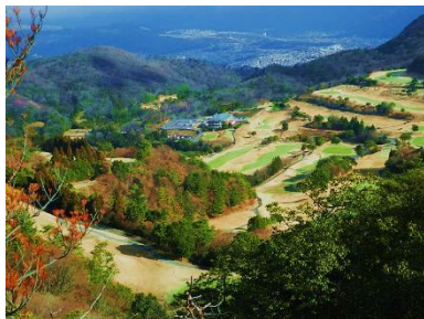
N氏の御希望で高圧線は削除

12:55山本に向かって中山縦走路を進む、左にケヤキヒルCCを見下す、絶景なのに何で高圧線があるんやとボヤキながらアップダウンを繰り返す、万願寺西山（361.6m）を通過、愛宕原GCを下に見て