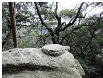
(弘法大師自作の亀石)