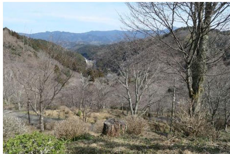
(桜にはまだ早い下千本)

ケーブルを横目に見ながら、七曲遊歩道を10分程歩くと、幣掛神社、ケーブルの乗降口に着きました。そこから少し歩くと、