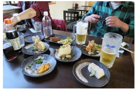
(残りわずかになった豆腐)

(13:30) 足取り軽く下りてきたのですが、お豆腐の専門店に立ち寄り、お腹いっぱいにも関わらずお豆腐料理を食べてしまいました。それが又美味しかった事。水が違うのかな～。次に行く機会があれば持ち帰りしたいものです。吉野駅に着くと電車が行った後だったので、駅前の茶店屋さんで過ごし、(17:09)の電車に乗り、それぞれ帰路に着きました。今日は、のんびりとしたハイキングでした。少々食べ過ぎましたが楽しかったです。