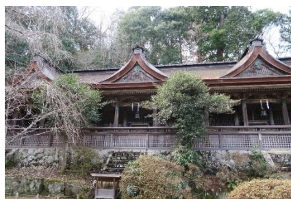
(吉野水分神社の境内)

殆ど車道を歩いてきましたが、この先辺りから所々は、幅の広い丸太の階段がありました。階段を半分以上登ると、息が切れそうになり止まりながら進みました。(私だけです)