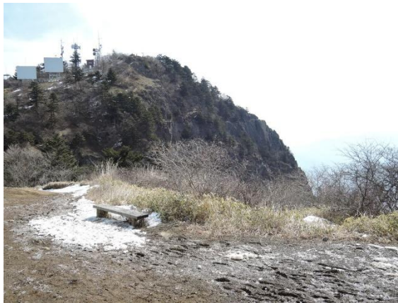
(四季樂園からの三ツ峠山)