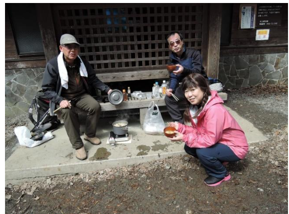
(下山後登山口でうどん鍋)