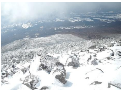
山頂直下からの眺め