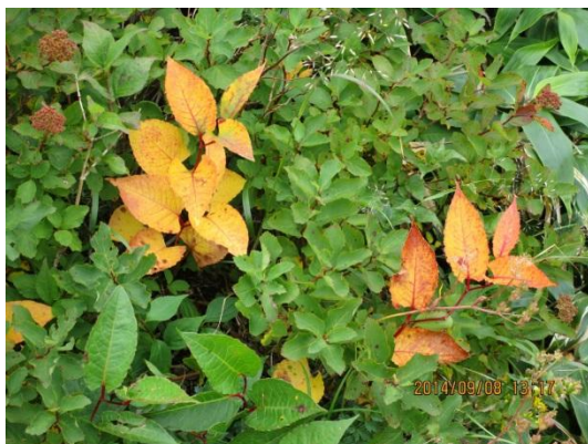
（すでに紅葉始まっている）