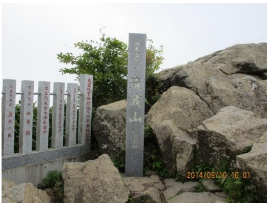
(筑波山、女体山山頂)