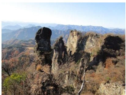
(大砲岩からの眺め)