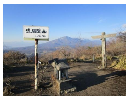
(浅間裏山山頂から浅間山)