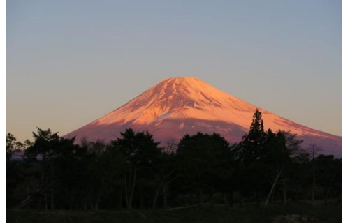
(登山口手前から、朝焼けの富士)

天気の良い日の富士山はいつ見ても綺麗だ。が、滅多にお目に掛かれない。今日はチャンスと朝5時に東京宅出発。裾野ICまで行き、そこから愛鷹登山口を目指す。7時前に登山口に到着、そこから富士見峠まで登り、黒岳をピストン、再び越前岳を目指す。コースは、標高差750m、コースタイム5時間程の普通の山道だが、富士山の眺望は素晴らしい。特にこの時期は、太陽が南に傾いているため、この方向からだと綺麗に見える。雲が上って来るまでの数時間、久々に富士山の雄姿を堪能できた。