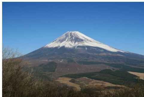
(黒岳山頂からの富士山)