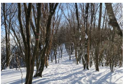
(新道峠～三峰山、縦走路)